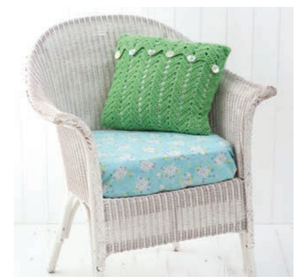
Dimensions approximatives de la housse: 35 x 30 cm.