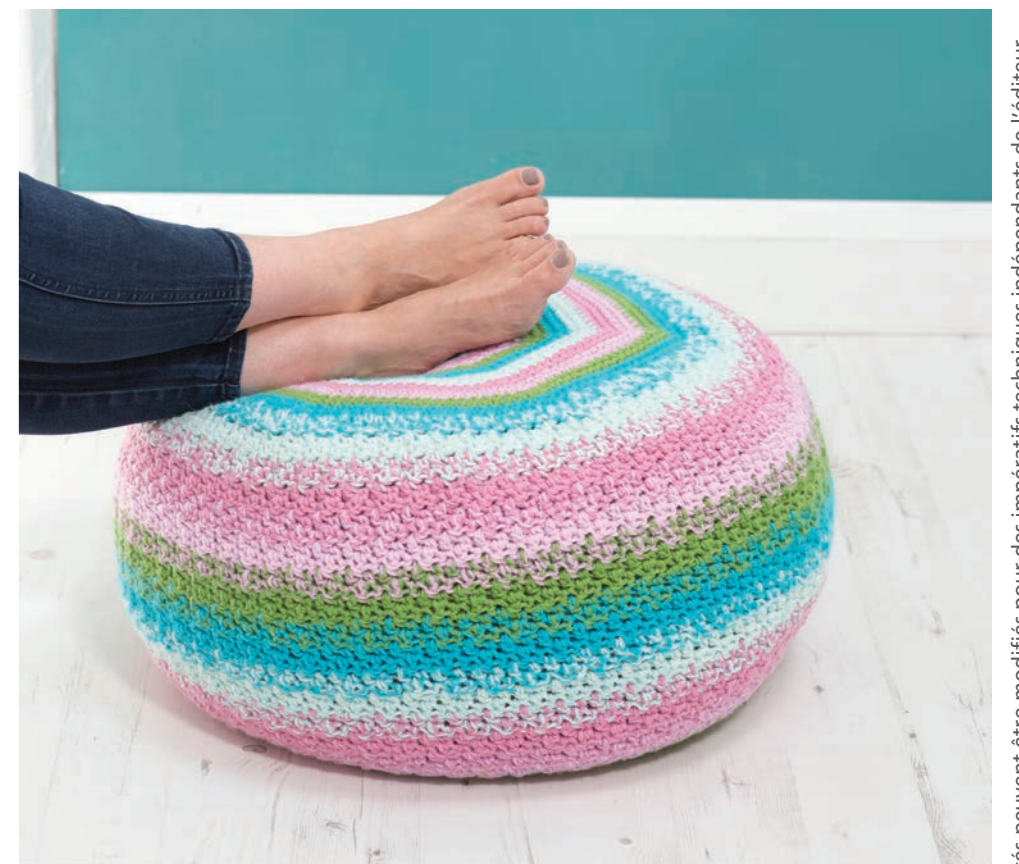
Dimensions approximatives: 50 cm de diamètre x 30 cm de hauteur.