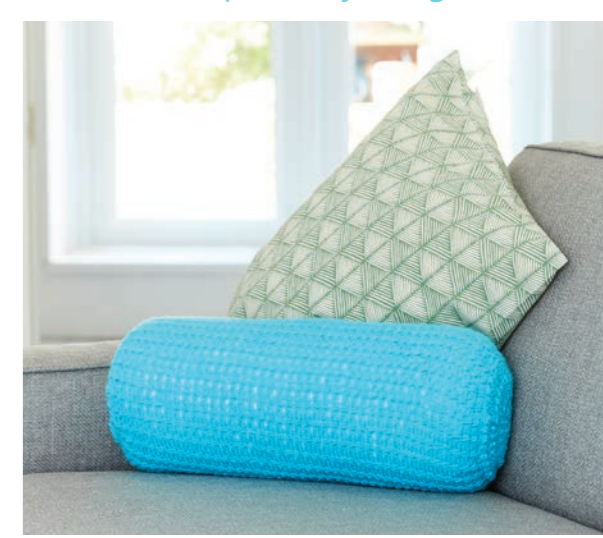
Dimensions approximatives de la housse: 45 cm de large x 17 cm de diamètre.

Chaque livraison comprend deux pelotes de 25 g (50% laine de grande qualité, fabriquée en Italie) avec lesquelles vous créez chacun des carrés de votre plaid au crochet, quatre coussins coordonnés et un magnifique pouf multicolore.