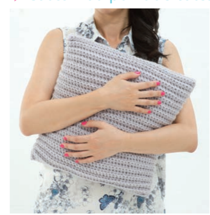
Dimensions approximatives de la housse: 40 x 40 cm.