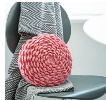
Dimensions approximatives de la housse: 35 cm de diamètre.