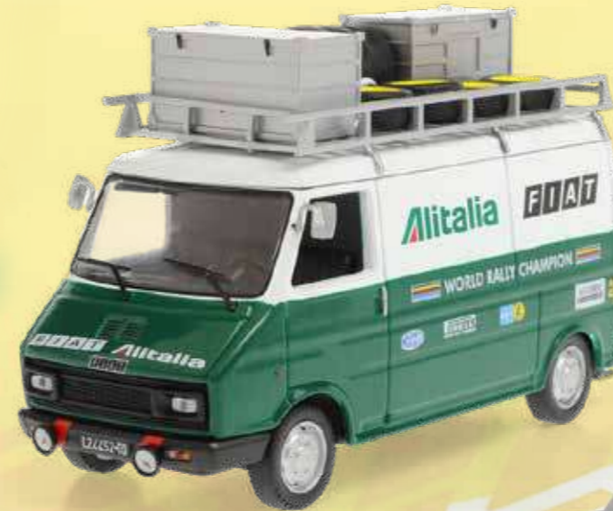
FIAT 242 Team Fiat Alitalia