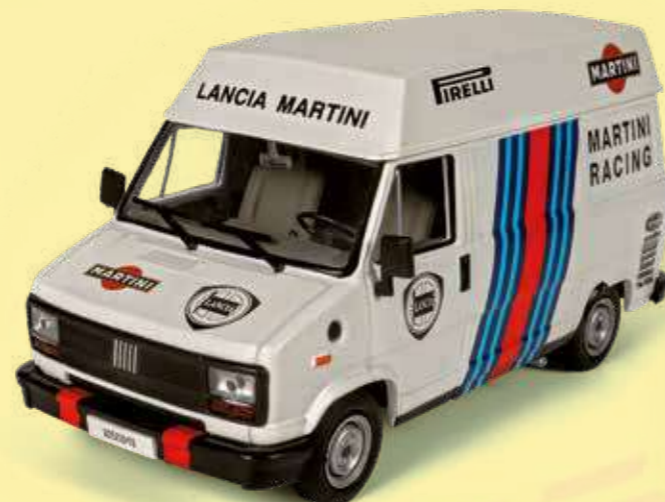
FIAT DUCATO Team Lancia Martini