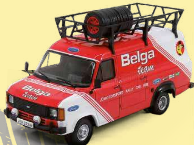
FORD TRANSIT MK2 Belga Team