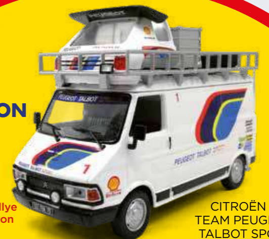
CITROËN C35 TEAM PEUGEOT TALBOT SPORT

Pour la première fois, découvrez les véhicules d'assistance des plus grands champions de rallye dans une collection exclusive.