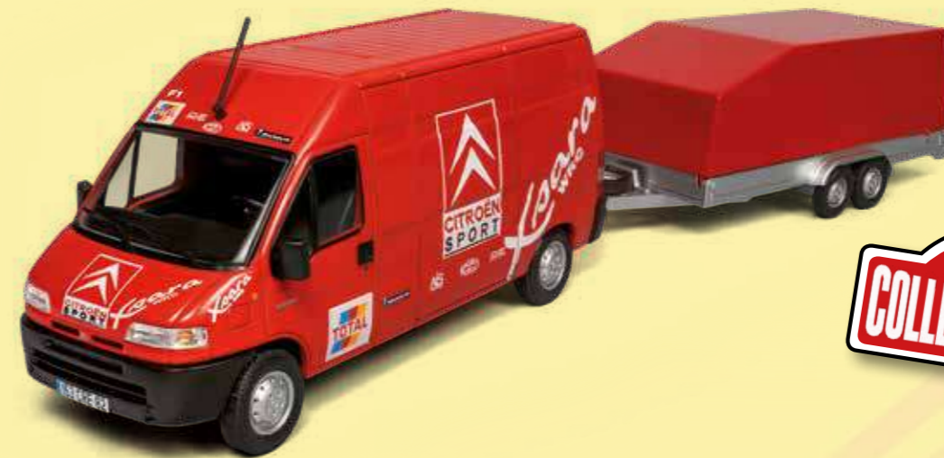
CITRÖEN JUMPER 2.8 HDI Team Citroën Sport