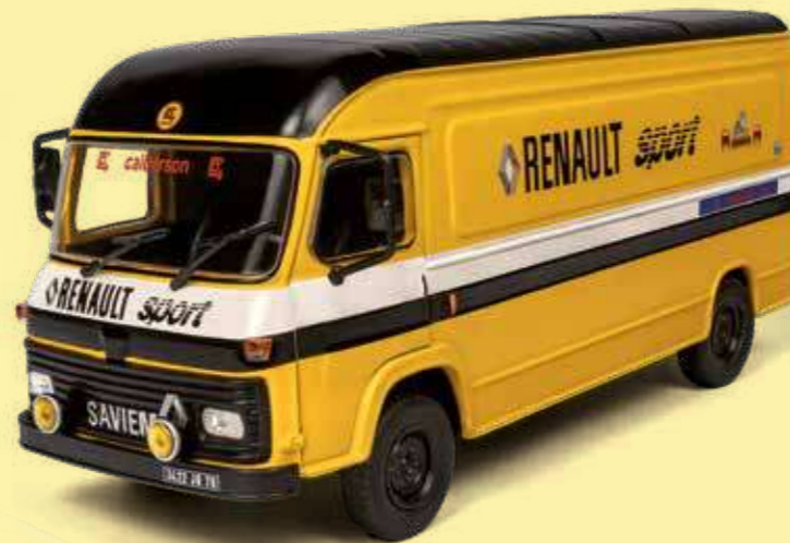
SAVIEM SG2 Team Renault Sport