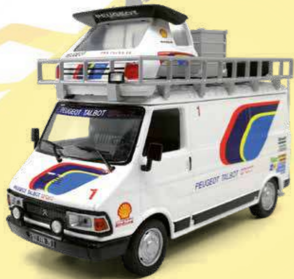
CITRÖEN C35 Team Peugeot Talbot Sport