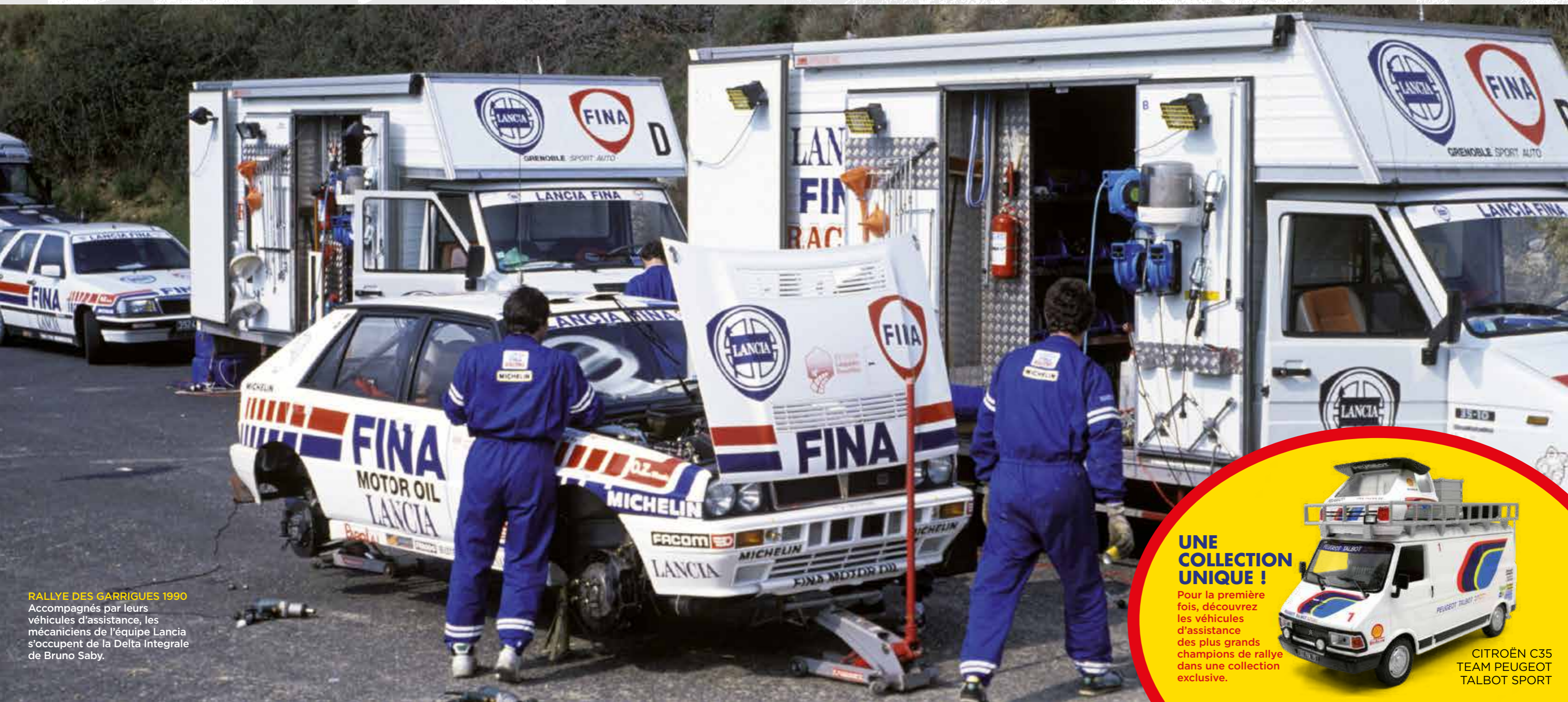
RALLYE DES GARRIGUES 1990 Accompagnés par leurs véhicules d'assistance, les mécaniciens de l'équipe Lancia s'occupent de la Delta Intégrale de Bruno Saby.

Collectionnez les miniatures les plus spectaculaires à l'échelle 1/43 de ces véhicules indispensables pour la logistique des équipes de rallye, témoins des plus grands exploits de la discipline. Une collection inédite, passionnante et complémentaire à celle des voitures de rallye proposée à la même échelle.