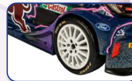
Matériaux de grande qualité et fabrication en métal et ABS injecté