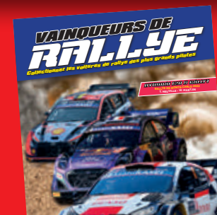
Hyundai i20 N Rally1 T. Neuville - W. Martijn Rallye de Monte-Carlo 2022

*Offre réservée aux souscripteurs. En cas de non disponibilité de l'un de ces cadeaux ou en raison de circonstances indépendantes de la volonté de l'éditeur, il sera remplacé par un article présentant des caractéristiques identiques ou supérieures. L'éditeur se réserve le droit de modifier le prix des livraisons en cas de hausse significative des coûts des matières premières et de production, des coûts de transport et du taux d'inflation.