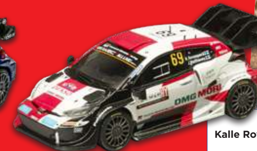
Toyota Yaris Rally1 Kalle Rovanperä - Jonne Haltunen Rallye Croatia 2022

*Offre réservée aux abonnés. Si ces cadeaux venaient à manquer, ils seraient remplacés par d'autres d'une valeur égale ou supérieure.