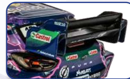
Chaque détail est reproduit avec soin et toujours à l'échelle