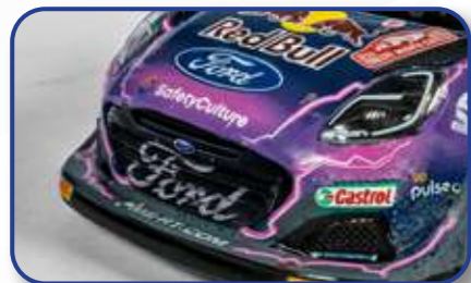
Pièces très réalistes avec un haut niveau de détails

P rofitez de cette offre pour collectionner les modèles les plus emblématiques qui ont participé aux championnats des rallyes de ces dernières années ainsi que les voitures les plus légendaires de tous les temps. Ces magnifiques modèles à l'échelle du 1/43e fabriqués en métal et en plastique ABS injecté plairont aux amateurs de belles miniatures comme aux passionnés des sports mécaniques.