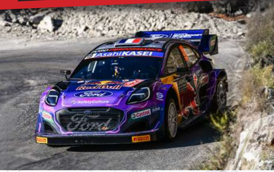
Ford Puma Rally1 S. Loeb - I. Galmiche Rallye de Monte-Carlo 2022