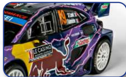
Décorations fidèles aux modèles d'origine