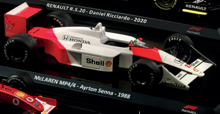
McLAREN MP4/4 - Ayrton Senna - 1988