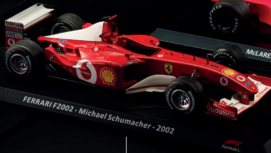
FERRARI F2002 - Michael Schumacher - 2002