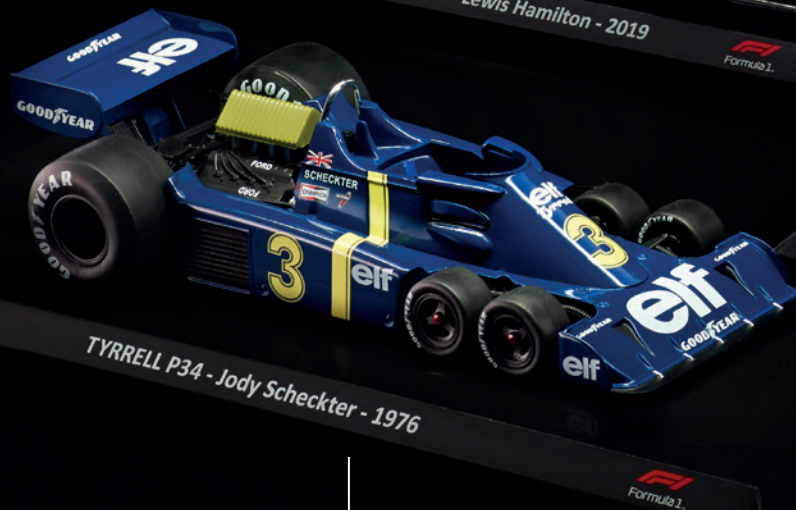
TYRRELL P34 - Jody Scheckter - 1976