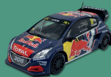
// PEUGEOT 208 WRX RALLYCROSS DA BÉLGICA 2018

O Pescarolo C60 Hybrid é uma evolução da barqueta Courage C60 desenvolvida sob a forma de protótipo de dois lugares para disputar as Le Mans Series e as 24 Horas de Le Mans.