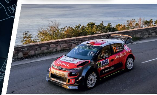
// CITROËN C3 WRC