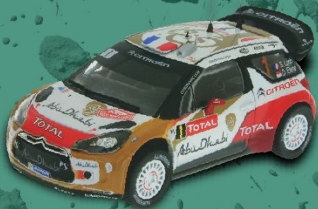
// CITROËN DS3 WRC MONTE-CARLO 2013

Com este carro, a Citroën e Sébastien Loeb deram o salto para o campeonato mundial de veículos de turismo em circuito (WTCC). Sem ser especialista na disciplina, Loeb rubricou quatro vitórias e doze pódios em 2015.