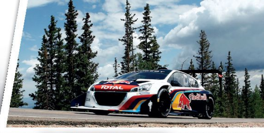
// PEUGEOT 208 T16

Com esta coleção de espetaculares modelos inéditos à escala 1/43, irá reviver os grandes momentos e as extraordinárias vitórias de Sébastien Loeb em todas as especialidades e reunirá todos os carros que o grande piloto francês pilotou ao longo da sua notável carreira desportiva.