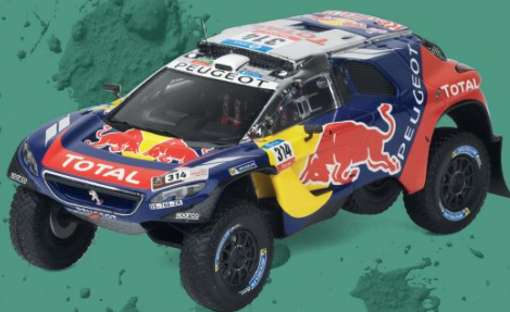
// PEUGEOT 2008 DKR DAKAR 2016

Nove vezes campeão mundial, Sébastien Loeb não participaria no campeonato mundial de 2013. Inscreveu-se em alguns ralis, nomeadamente o do Mónaco que venceu pela sétima vez na sua carreira.