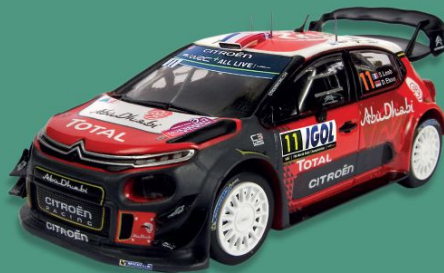
// CITROËN C3 WRC TOUR DE CORSE 2018

O bólido com que em 2013 Sébastien Loeb pulverizou o recorde da lendária rampa de Pikes Peak nos Estados Unidos. Uma máquina de 850 cv, com transmissão integral que quase não chegava a pesar 850 kg.