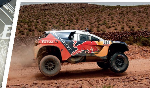
// PEUGEOT 2008 DKR