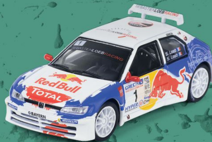
// PEUGEOT 306 MAXI KIT CAR RALLY DE HAUTE-PROVENCE 2017

O Citroën C3 WRC que se estreou no Campeonato do Mundo em 2017 continuou a carreira em 2018. No Tour de Corse desse ano, Loeb mostrou que continuava a ser muito eficaz nos rallies.