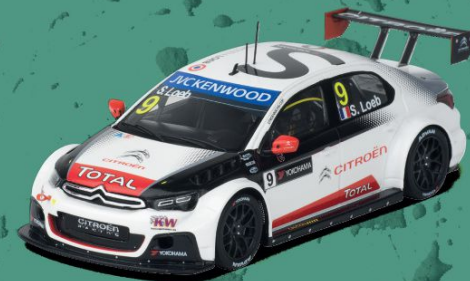
// CITROËN C-ÉLYSÉE WTCC ARGENTINA 2015

Um sonho de juventude para Loeb, que sempre desejava ser piloto. Em 2017, comprou em segunda mão este Kit Car com um motor de 2 litros, preparou-o e alinhou em duas provas. Venceu a primeira, o Rally de Haute-Provence, com a sua mulher Séverine como navegadora.