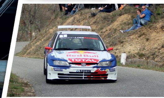
// PEUGEOT 306 MAXI KIT CAR