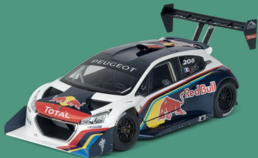
// PEUGEOT 208 T16 RAMPA DE PIKES PEAK 2013

O bólido com que em 2013 Sébastien Loeb pulverizou o recorde da lendária rampa de Pikes Peak nos Estados Unidos. Uma máquina de 850 cv, com transmissão integral que quase não chegava a pesar 850 kg.