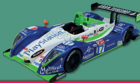
// PESCAROLO C60 HYBRID 24 HORAS DE LE MANS 2006

O carro com que a Peugeot se apresentou no Dakar em 2016 para se impor no raide mais duro do mundo. Loeb, que se estreava na especialidade, liderou até à jornada de descanso e terminou entre os dez primeiros.