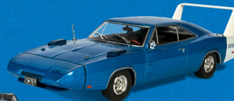
DODGE CHARGER DAYTONA (1969)