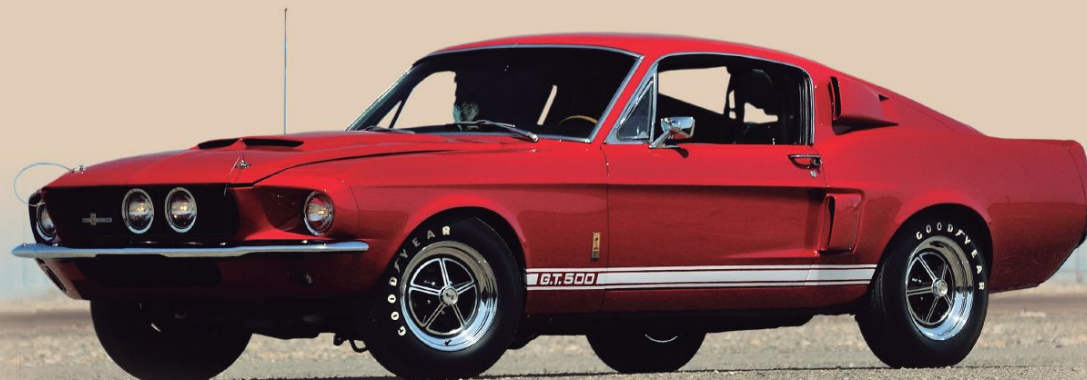
FORD MUSTANG SHELBY GT500 (1967)

Esta coleção percorre esse momento crucial do automobilismo norte-americano com a melhor seleção de modelos das grandes marcas: Chevrolet , Ford , Plymouth , Pontiac , Oldsmobile , Dodge e AMC . Enquanto a maioria delas continua ativa, oferecendo modelos em todos os mercados mundiais, outras já não existem, mas deixaram uma marca profunda no coração de todos os fãs.