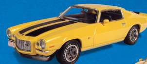
CHEVROLET CAMARO Z/28 (1970)

A versão mais atrevida da segunda geração do Camaro.