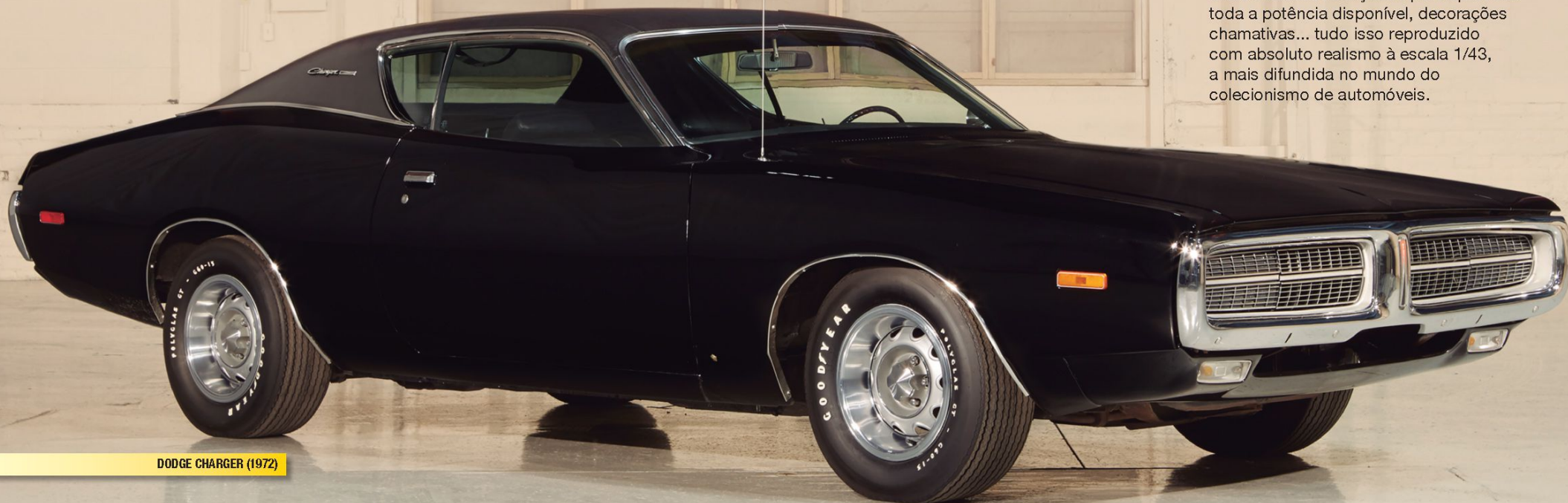
DODGE CHARGER (1972)

Motores V8, capôs com grandes entradas de ar, carrocerias de quase 5 metros, eixos traseiros reforçados para aproveitar toda a potência disponível, decorações chamativas... tudo isso reproduzido com absoluto realismo à escala 1/43, a mais difundida no mundo do colecionismo de automóveis.