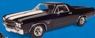
CHEVROLET EL CAMINO (1970)

Nem as pick-up escaparam do fenômeno muscle .