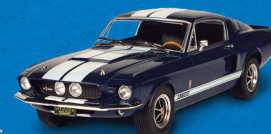
FORD MUSTANG SHELBY GT500 (1967)

Um dos muscle cars mais famosos do seu tempo.