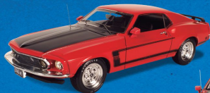
FORD MUSTANG BOSS (1969)

O espírito radical do Mustang na sua máxima expressão.