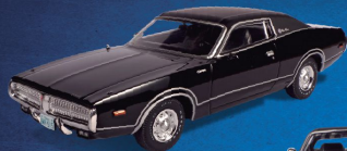
DODGE CHARGER (1972)

Um muscle car transformado em coupé de luxo.