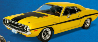
DODGE CHALLENGER R/T 440 (1970)