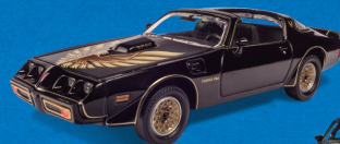
PONTIAC FIREBIRD TRANS AM (1977)

O irmão "popular" e mais poderoso do Camaro.