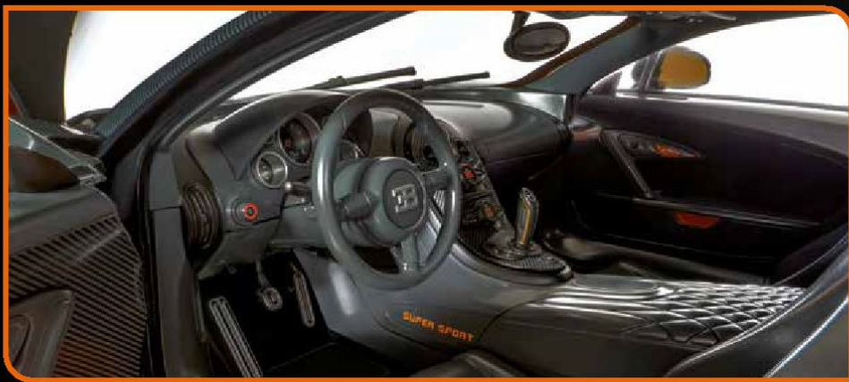
• Interiores do habitáculo de alta qualidade