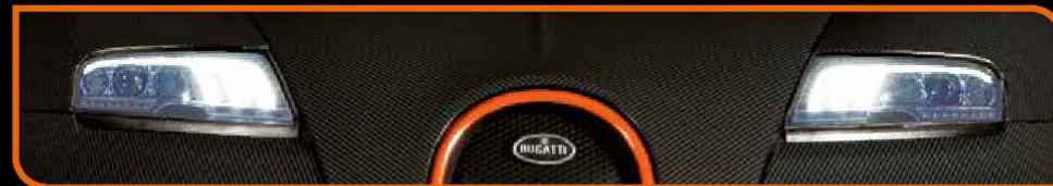
• Os faróis acendem