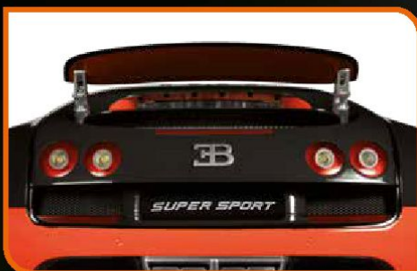
• Uma estética impressionante