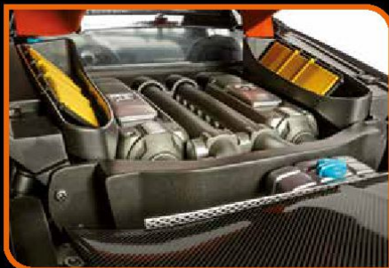
• Motor detalhado com grande precisão