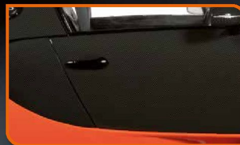
• As portas abrem