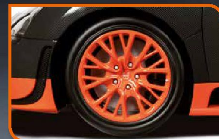
• Rodas direcionáveis com o volante