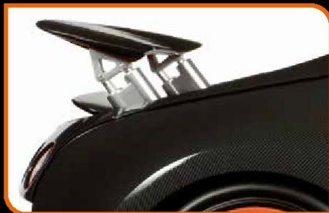
• Ailerons ativos, como no modelo real