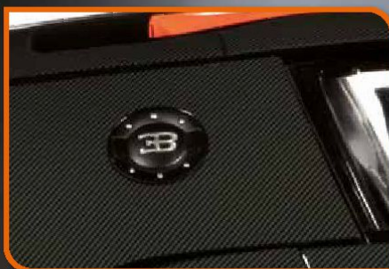
• Painéis da carroçaria em metal