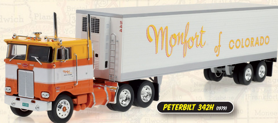
PETERBILT 342H (1979)