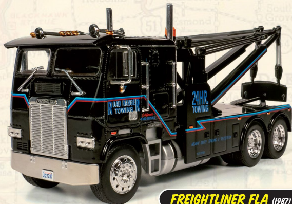
FREIGHTLINER FLA (1987)

Fabricadas com metal e plástico injetado, as réplicas em miniatura destes colossos da estrada vão satisfazer os desejos dos coleccionadores mais exigentes!