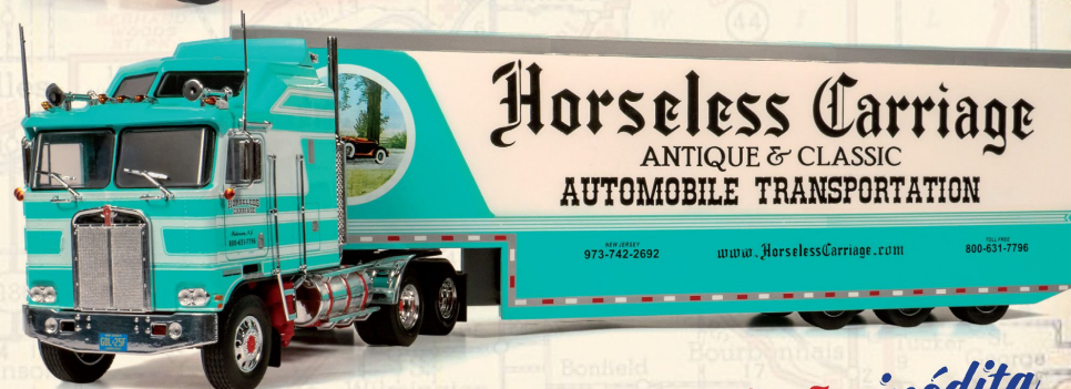
KENWORTH K100 AERODYNE (1976)