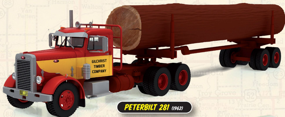
PETERBILT 281 (1962)