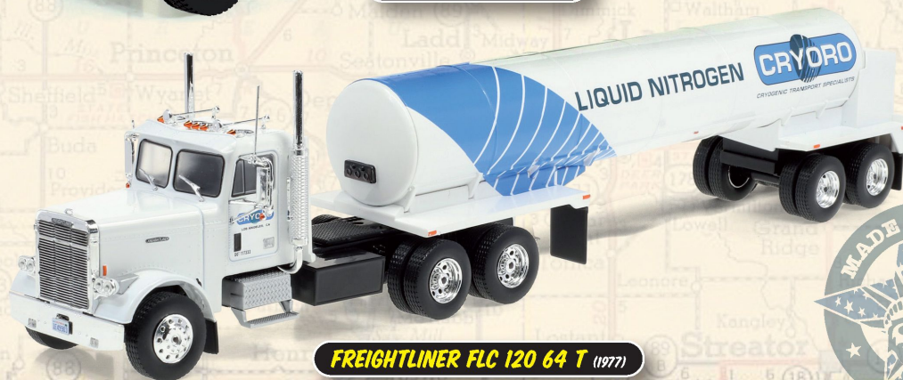
FREIGHTLINER FLC 120 64 T (1977)