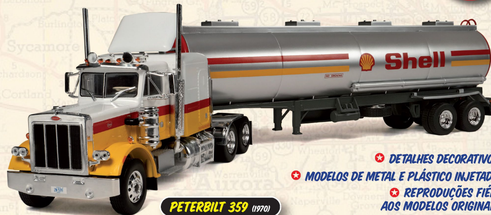
PETERBILT 359 (1970)