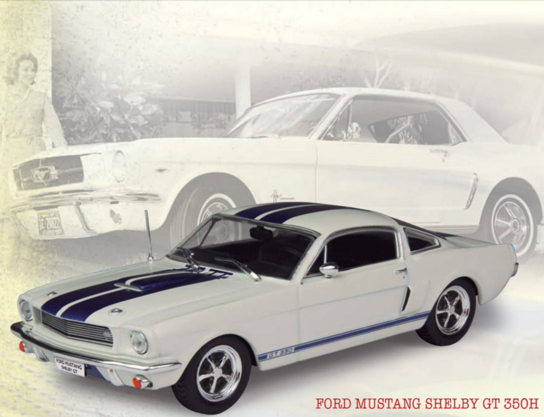
FORD MUSTANG SHELBY GT 350H