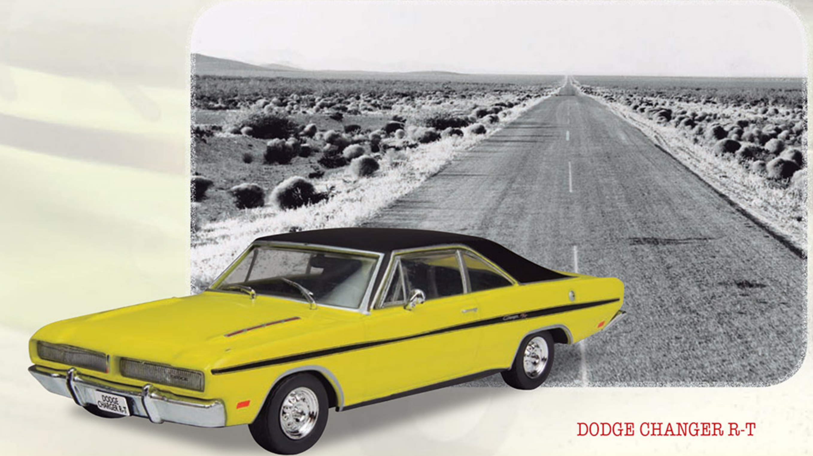
DODGE CHANGER R-T

Los autores se reservan el derecho a modificar las características y el precio de venta de los componentes de la colección. Objeto para coleccionistas adultos. No recomendado para menores de 14 años.