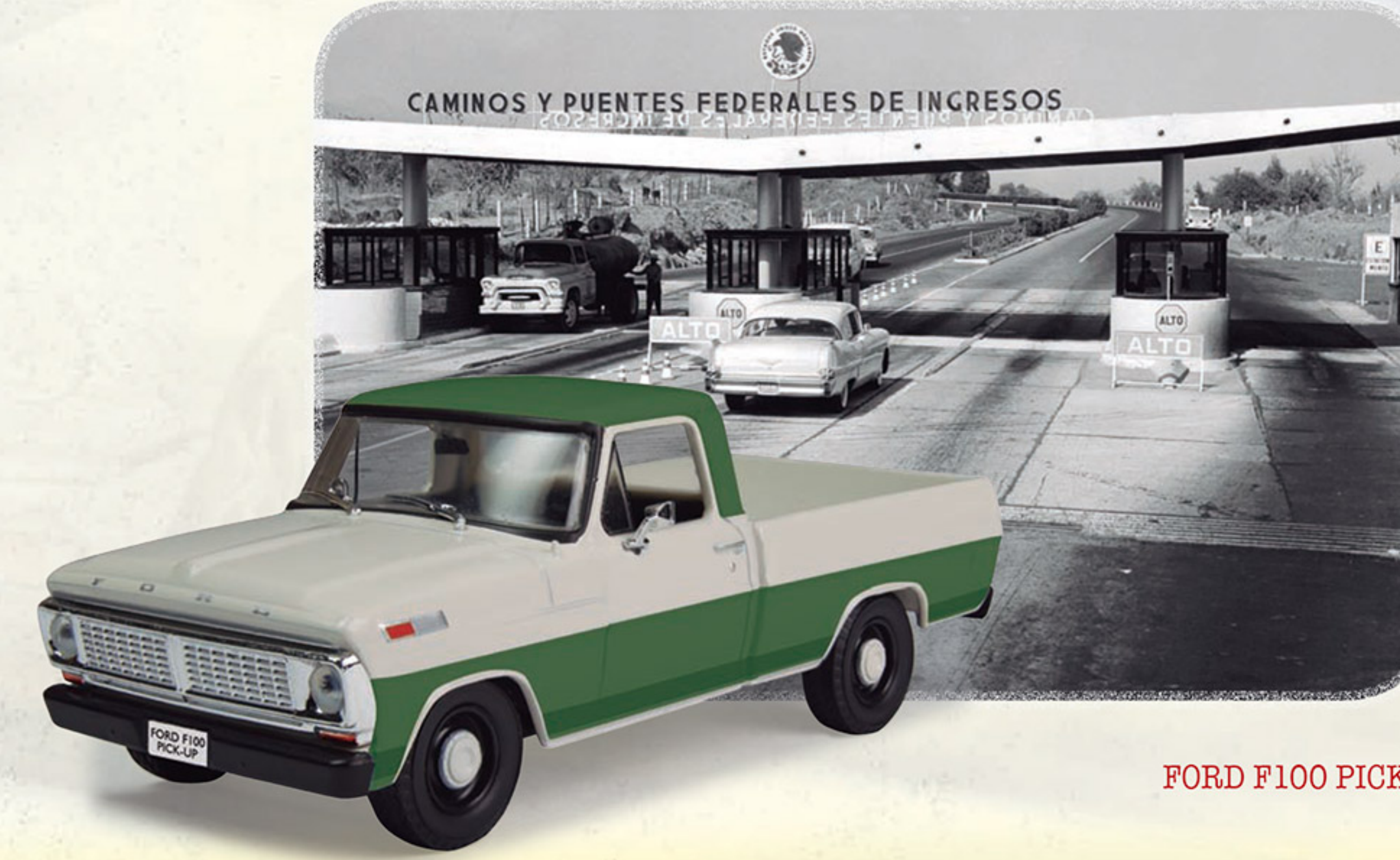
FORD F100 PICK-UP