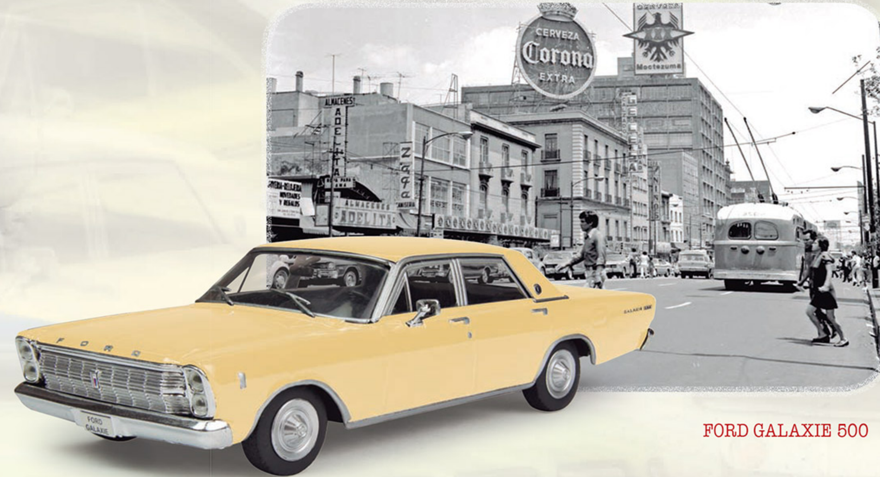
FORD GALAXIE 500