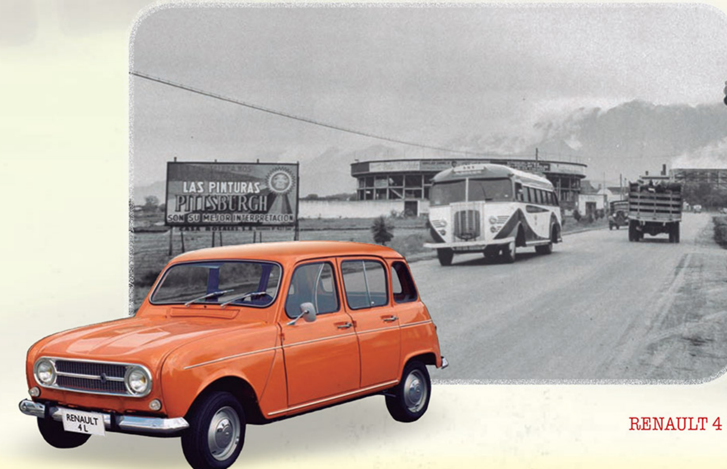
RENAULT 4 L