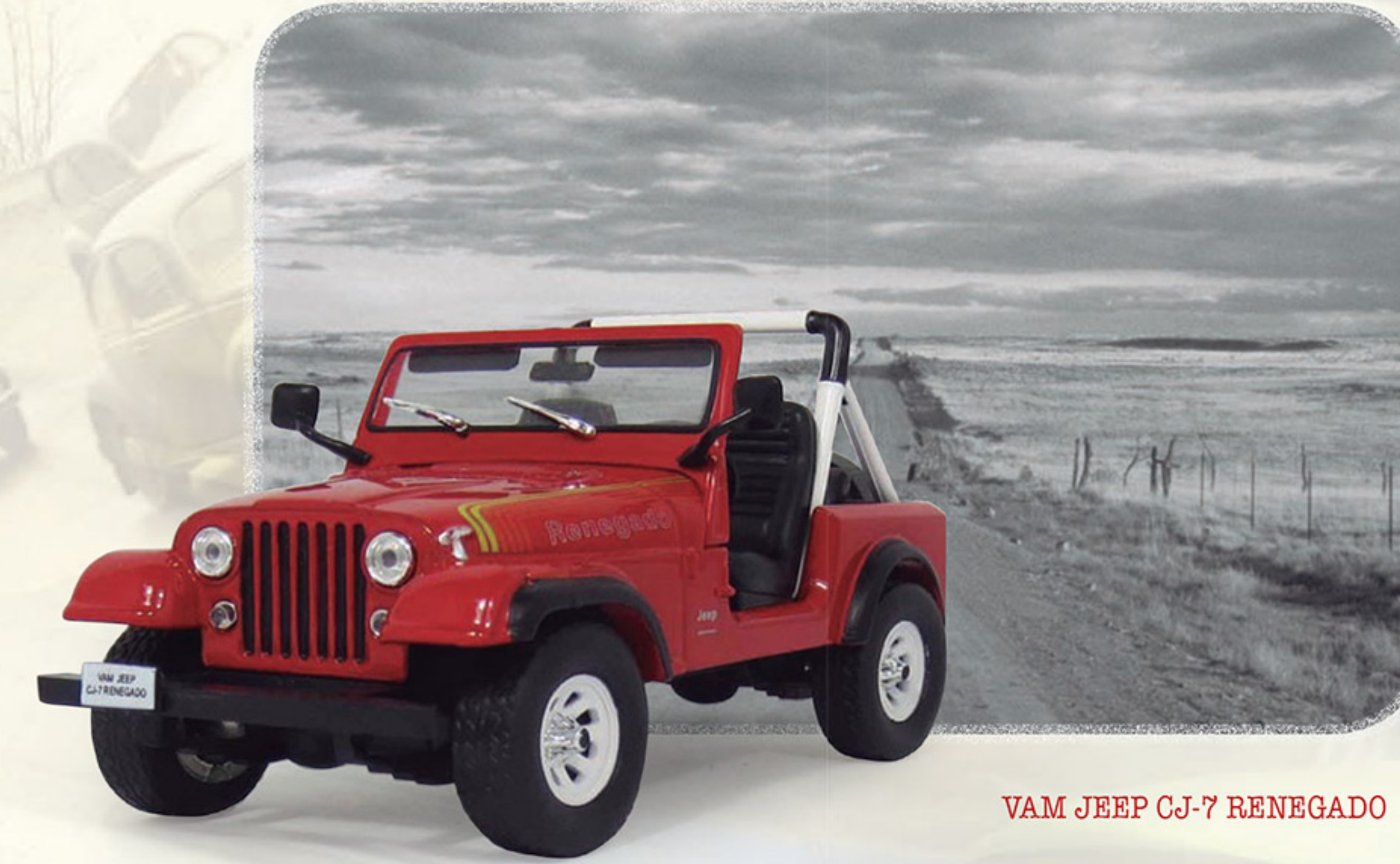
VAM JEEP CJ-7 RENEGADO