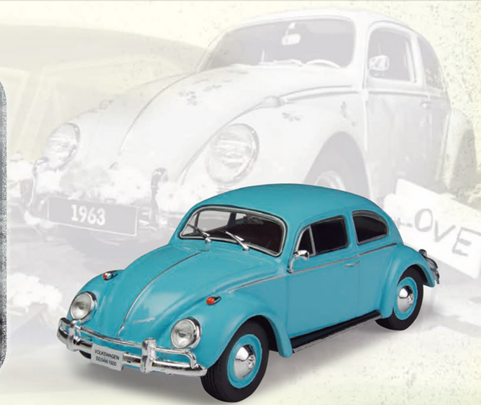
VOLKSWAGEN SEDÁN «VOCHO» 1500