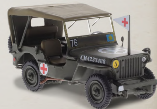
JEEP WILLYS MB BÉLGICA, 1944