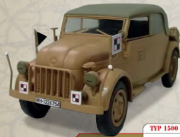
TYP 1500 A KOMMANDERWAGEN AUTRÍA, 1943

Este automóvil técnicamente avanzado fue adoptado por el ejército francés al principio de la guerra y se convirtió en un símbolo de la resistencia. Fue presentado en 1934 y se convirtió en una de las gamas de automóviles más populares de la marca francesa Citroën.