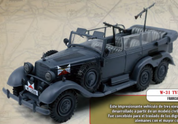
W-31 TYP 64-540 FRANCIA, 1940

Este impresionante vehículo de tres ejes y todoterreno fue desarrollado a partir de un modelo civil lanzado en 1926. Fue concebido para el traslado de los dignatarios y oficiales alemanes con el mayor confort y seguridad.