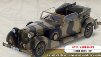
BSSA KARIOLET ESTADOS UNIDOS, 1942

Producido por la firma alemana Opel únicamente durante los años 1938 y 1939. Se encuadraba en la categoría de vehículos de lujo y fue el único modelo de esta gama lanzado en la década de 1930, antes del inicio de la Segunda Guerra Mundial.