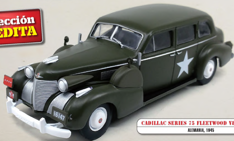
CADILLAC SERIES 75 FLEETWOOD V8 LIMOUSINE ALEMANIA, 1945