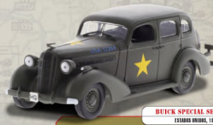
BUICK SPECIAL SERIES 40 ESTADOS UNIDOS, 1942

Vehículo todoterreno de mando y transmisiones que se empleó también como tractor de artillería gracias a su gran robustez, movilidad y capacidad de carga. Fue desarrollado en Alemania a finales de los años treinta.