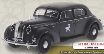
ADMIRAL KARIOLET ALEMANIA, 1940

Asignado al general George S. Patton en 1945, fue uno de los muchos automóviles utilizados por el Ejército estadounidense como vehículo de enlace y transporte de personalidades, aunque no estaba normalizado o fabricado específicamente para uso militar.