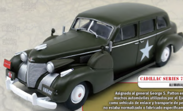
CADILLAC SERIES 75 FLEETWOOD V8 ALEMANIA, 1940

Este impresionante vehículo de tres ejes y todoterreno fue desarrollado a partir de un modelo civil lanzado en 1926. Fue concebido para el traslado de los dignatarios y oficiales alemanes con el mayor confort y seguridad.