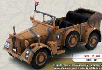
KFZ. 15 901 ALEMANIA, 1942

El último modelo lanzado por la empresa alemana Opel antes de iniciarse la guerra. Su volumen interior y las buenas prestaciones de su motor lo convertían en un automóvil muy adecuado para el transporte de autoridades.