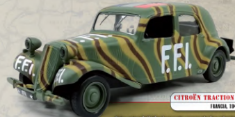
CITROËN TRACTION AVANT II BL FRANCIA, 1944

En 1937 el BSSA se convirtió en el modelo de más alta gama de la firma alemana Horch. Era la versión mejorada del modelo B53, con un motor más potente y ofreció unas generosas proporciones por lo que fue muy valorado durante la guerra.