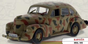
KAPITÄN ALEMANIA, 1943

Vehículo ligero todoterreno desarrollado en 1940 para el Ejército estadounidense. Diseñado en un tiempo récord por la firma Bantam a partir de las especificaciones requeridas por los militares, su versatilidad y robustez lo convirtieron en el vehículo más icónicos de la Segunda Guerra Mundial.