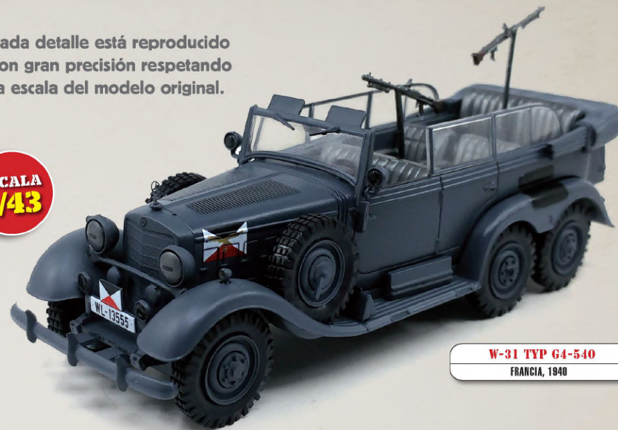
W-31 TYP G4-540 FRANCIA, 1940