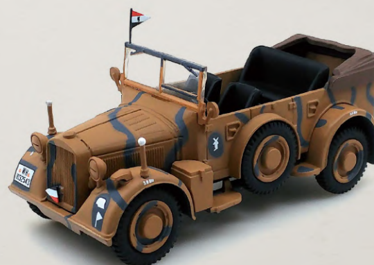
KFZ. 15 901 RUSIA, 1942