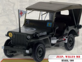
JEEP WILLYS MB EE.UU., 1944

Vehículo ligero todoterreno desarrollado en 1940 para el Ejército estadounidense. Diseñado en un tiempo récord por la firma Bantam a partir de las especificaciones requeridas por los militares, su versatilidad y robustez lo convirtieron en el vehículo más icónicos de la Segunda Guerra Mundial.