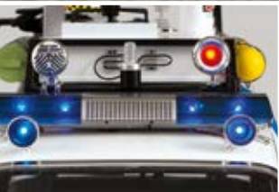
LUCES Y SONIDO