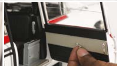
PUERTAS CON ACCESORIOS