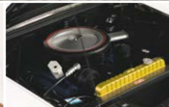
REPRODUCCIÓN DEL MOTOR