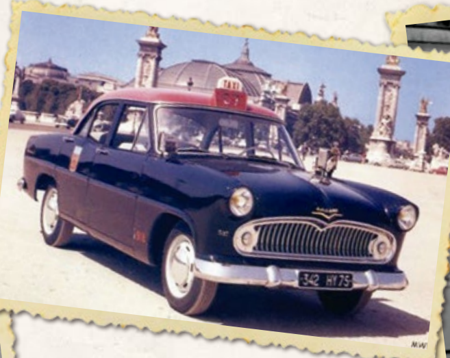
La Simca Ariane G7, un fabuleux taxi.