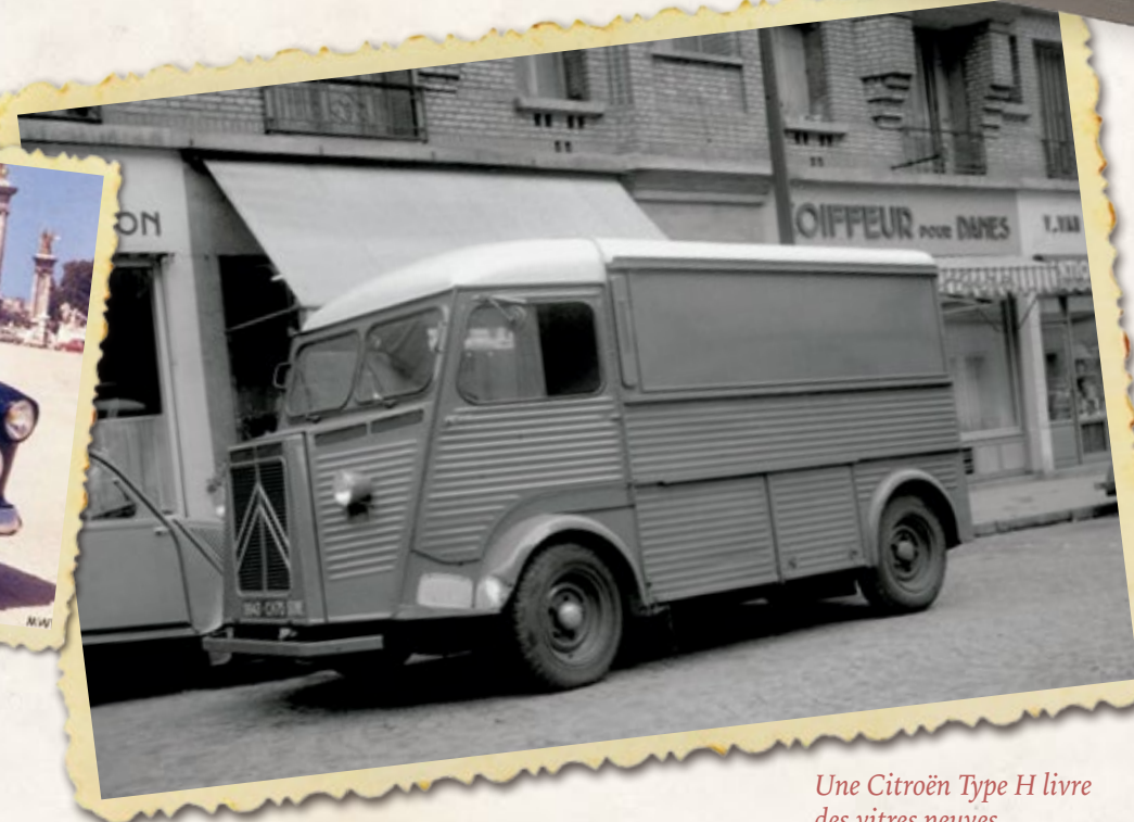
Une Citroën Type H livre des vitres neuves.