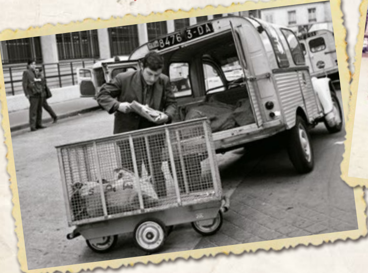
La Citroën 2CV du facteur.