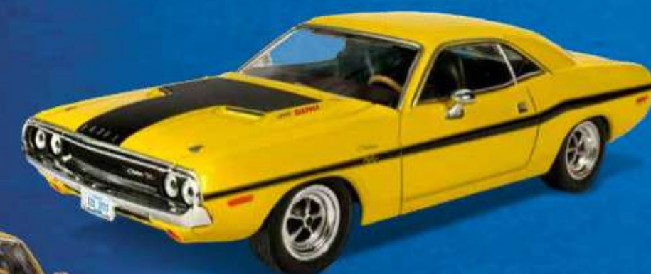
Dodge Challenger R/T 440 (1970)