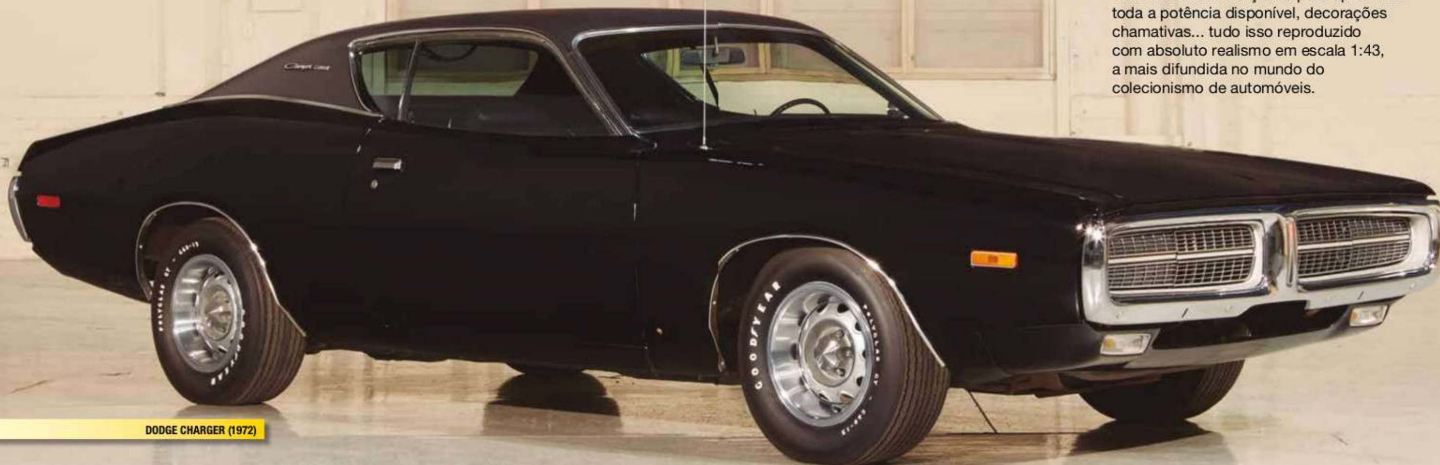
DODGE CHARGER (1972)

Motores V8, capôs com grandes entradas de ar, carrocerias de quase 5 metros, eixos traseiros reforçados para aproveitar toda a potência disponível, decorações chamativas... tudo isso reproduzido com absoluto realismo em escala 1:43, a mais difundida no mundo do colecionismo de automóveis.