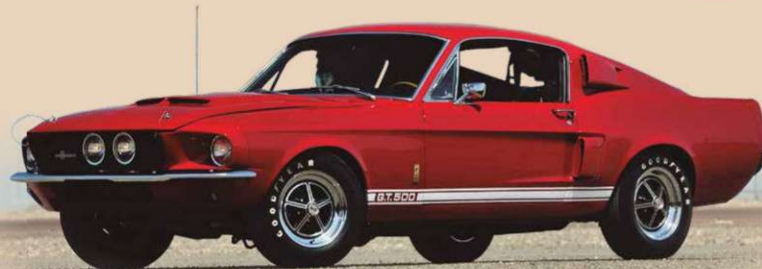
FORD MUSTANG SHELBY GT500 (1967)

Esta coleção percorre esse momento crucial do automobilismo norte-americano com a melhor seleção de modelos das grandes marcas: Chevrolet , Ford , Plymouth , Pontiac , Oldsmobile , Dodge e AMC . Enquanto a maioria delas segue ativa, oferecendo modelos em todos os mercados mundiais, outras não existem mais, mas deixaram uma marca profunda no coração de todos os fãs.