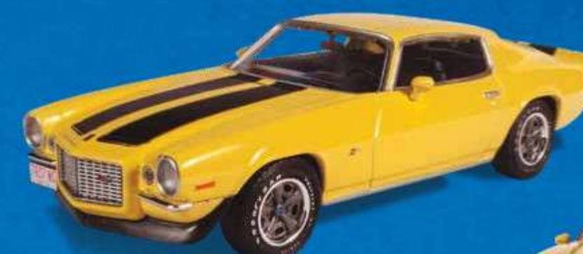
CHEVROLET CAMARO Z/28 (1970)

A versão mais atrevida da segunda geração do Camaro.