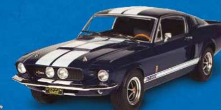
FORD MUSTANG SHELBY GT500 (1967)

Um dos muscle cars mais famosos do seu tempo.