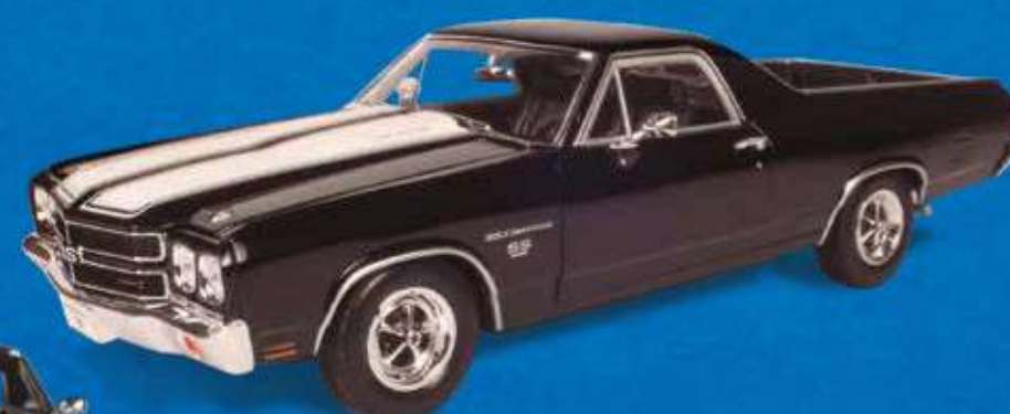
CHEVROLET EL CAMINO (1970)

Nem as picapes escaparam do fenômeno muscle .