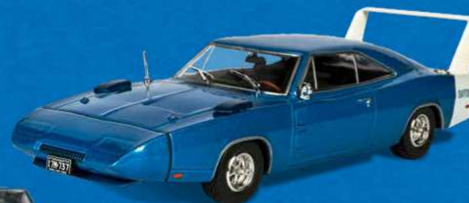
Dodge Charger Daytona (1969)