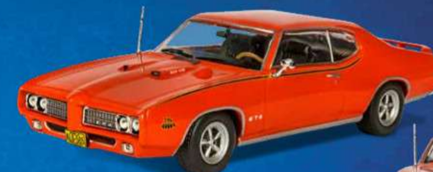
Pontiac GTO "The Judge" (1969)