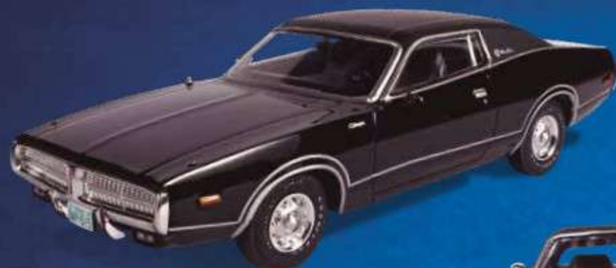
DODGE CHARGER (1972)

Um muscle car transformado em cupê de luxo.