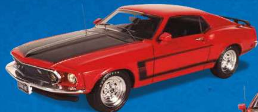
FORD MUSTANG BOSS (1969)

O transgressor espírito da Mustang em sua máxima expressão.