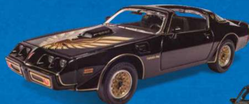
PONTIAC FIREBIRD TRANS AM (1977)

O irmão "popular" e mais poderoso do Camaro.